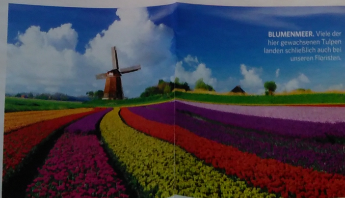
BLUMENMEER. Viele der hier gewachsenen Tulpen landen schließlich auch bei unseren Floristen.