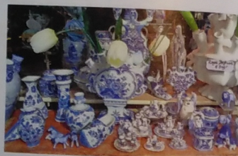
DELFT. Das berühmte blaue Porzellan wird hier seit dem 17. Jahrhundert hergestellt.