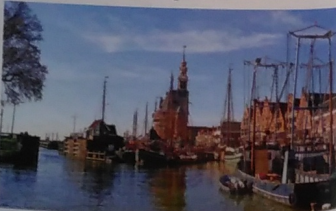
HOORN. Ein Bummel durch den malerischen Hafen der Stadt in Westfriesland.