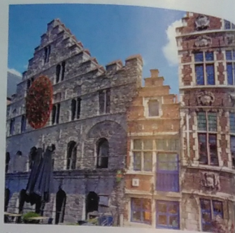
GENT ist nach Antwerpen die zweitgrößte Stadt der Region Flandern in Belgien.

schwimmenden Hotels sind. Alle werden aufgefordert, vor dem Essen ihre Hände zu desinfizieren, die Neuen sind kurz irritiert. Zurück in der Kabine löst sich das Bettenrätsel. Die Rückwand des Sofas wurde heruntergeklappt und lädt zum bequemen Schlafen ein, während die MS Nestroy Kurs auf das riesige Markermeer nimmt. Jedes Schiff spricht während der Fahrt mit dem Kapitän, wie es so nett heißt, sensible Ohren sollten Ohropax mitnehmen. Am nächsten Morgen beginnt das dichte Besichtigungsprogramm, das im mittelalterlichen Städtchen Hoorn beginnt. Von dort geht es in den nächsten fünf Tagen weiter zu den berühmtesten Sehenswürdigkeiten von Holland und Flandern, beginnend mit dem pittoresken Fischerdorf Volendam. Das knapp 12 Meter breite Schiff legt die weiten Strecken auf den Flüssen Amstel und Schelde nächstens zurück. Wer morgens nicht auf Nana Mouskouris grollen Weckruf via Lautsprecher wartet („Guten Morgen, Sonnenschein!“), kann die Anlegemanöver mitverfolgen. Viele der 19 Windmühlen von Kinderdijk sind mittlerweile zu Villen wohlhabender Bürger umfunktioniert, eine ist für Touristen geöffnet. Von dort sind es nur 15 Kilometer nach Rotterdam, aber davor fotografieren wir noch die