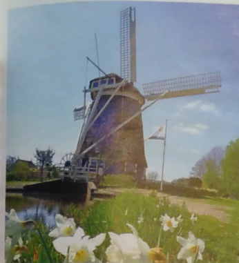
AMSTERDAM. Windmühlen und die Niederlande sind untrennbar miteinander verbunden.

blau-weißen Fliesen von Delft, verkosteten Gouda in einer Käserei und staunen über endlose Deiche, die das Flachland vor den Meeresfluten abschirmen.