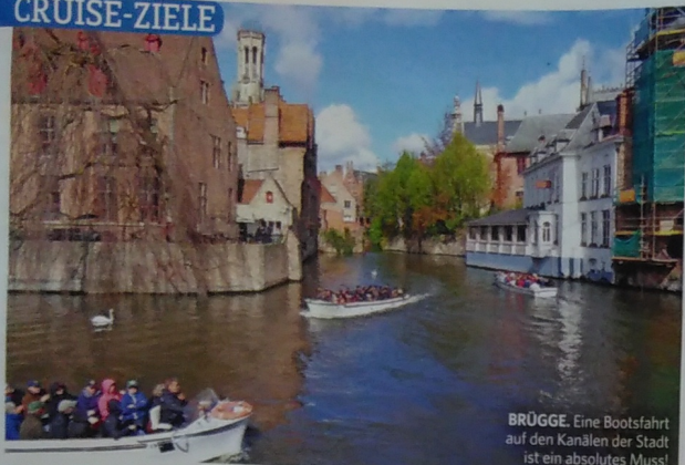
BRÜGGE. Eine Bootsfahrt auf den Kanälen der Stadt ist ein absolutes Muss!